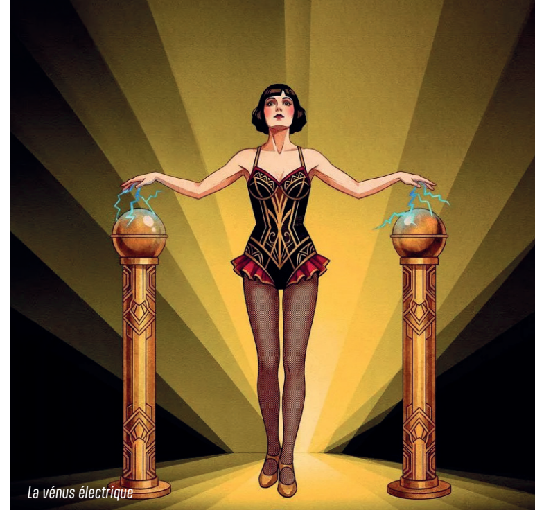
La vénus électrique

18h30 Séance avec animation / Film environ 8 min après / 20h30 Film en Vostf / 20h30 Film en 3D / Coup de cœur