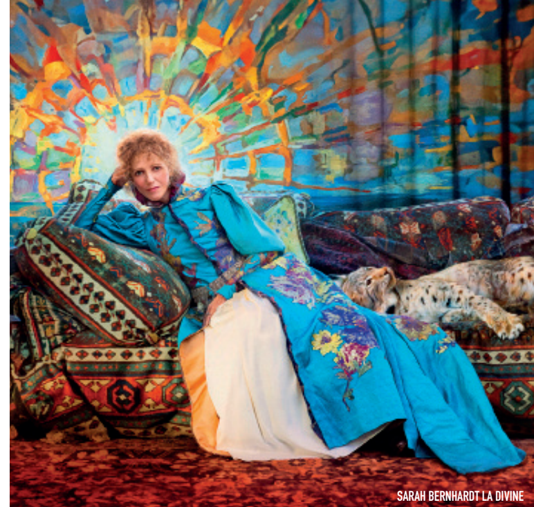
SARAH BERNHARDT LA DIVINE

1830 Séance avec animation / Film environ 10 min après / 20h30 Film en Vostf / 20h30 Film en 3D