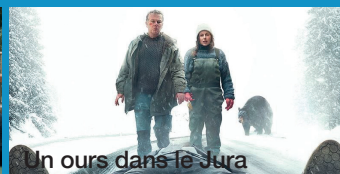
Un ours dans le Jura