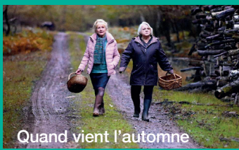
Quand vient l'automne